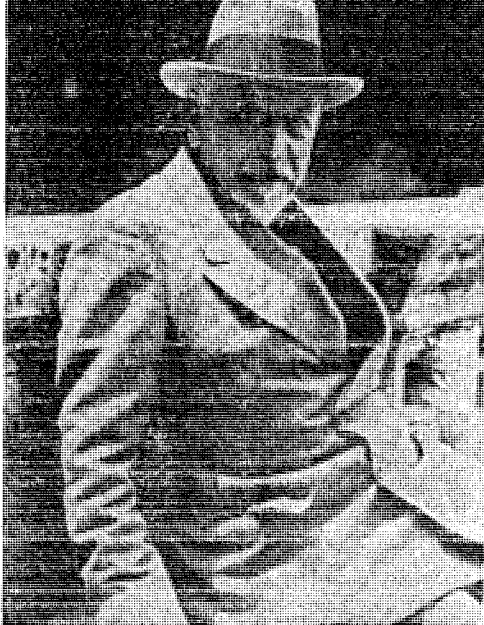
Ο Λουιτζί Πιραντέλλο στην ώριμότητά του.

άντίθεση ανάμεσα στη ζωή και στην έκφρασή της, που είναι τόσο φανερή πιά στη σύγχρονη σκέψη. Και πιά είναι τά πρόσωπα ενός τέτοιου θεάτρου; Όχι άσφαλως «τυπικοί», όπως μπορεί νά φανταστεί κανείς εκ πρώτης όψεως, όχι σύμβολα,