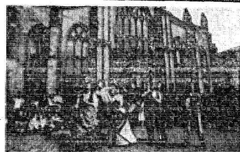
Θεατρική παράσταση σε θέατρο, μερικοί οι πολλοί έκπληκτοι και έκθαμβωτοι από έκπληκτους. Τό κομμάτι κόνιεται από έκπληκτους - γίγρια. Είναι η επίεπρία θαυμάσια.

Ζούμε κατά τό ήμισο μέσα στο όνειρο και κατά τό άλλο ήμισο είμαστε παραδομένοι στην αυθαίρεση τών αισθησών μας. Σπάνια ο άνθρωπος ξέρει να δικαιολογήσει τις σημαντικότερες πράξεις του, αυτές που είναι άποφασιστικές γιά τήν ύπαρξή του. Πώς έγινε αυτό; Και ή άπόννηση άντιχεί πάντα κάποια έτσι: δέν έξερω πώς. Η άντίθεση άνάμεσα στην σκέψη και στην πραγματικότητα βρίσκει τήν άντοκροση τής στην άντίθεση