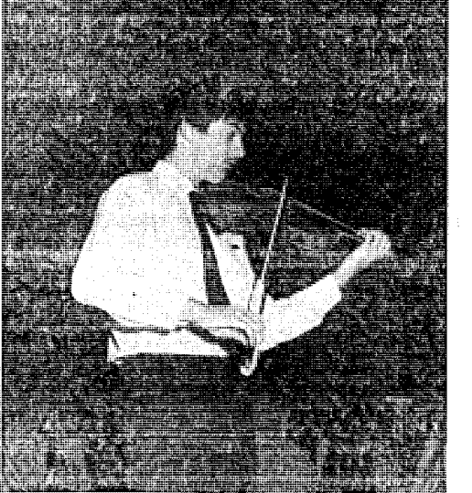
Ο Λεωνίδας Καβάκος με πιά άκόμ τις συνθέσεις του έδωσε στη Θεσσαλονίκη και κατέληξε τό κοινό.

- Τί θέλω νά πείς γιά τήν έπιλογή σου καριέρα;