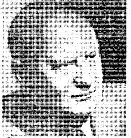
Είκοσιτέσσερις είναι ο αριθμός των τελευταίων δεκαετιών

πρώτη φορά έφαρμογή των άναλογιών τίς χροσής τού ή στα έργα τού Τζών Καλιτζή «Κατασκευή από μέταλλο» και