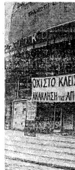
Από τα άσχημα φαινόμενα στα κρατικά θέατρα. «Κλείσιμο θεάτρων» και άπεργιες...